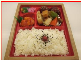
特製 中華弁当 ¥650 (税込)