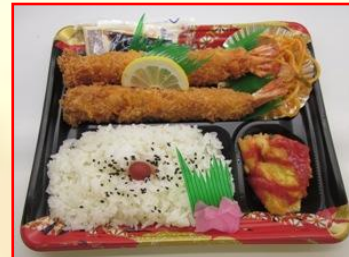
旨 シャンボ'エ'フライ弁当 ¥750 (税込)