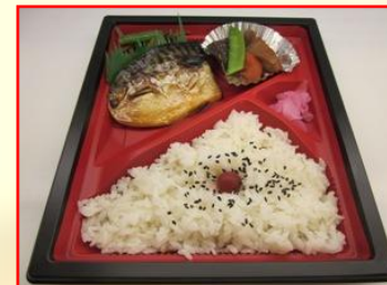
鯖の煮付け弁当 ¥650 (税込)