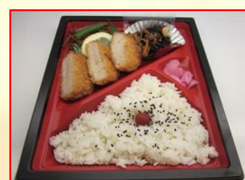
ヒレカツ弁当 ¥600 (税込)