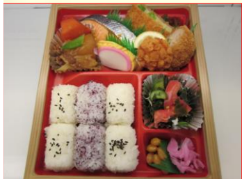
特製 幕の内弁当 ¥680 (税込)