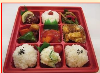
中華御膳 ¥680 (税込)