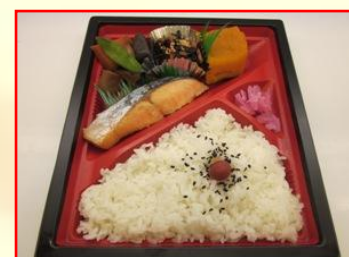
ヘルシー弁当 ¥520 (税込)