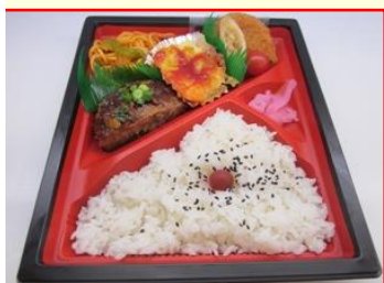
洋風弁当 ¥650 (税込)