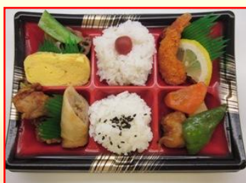
たまて箱 (6彩) ¥520 (税込)