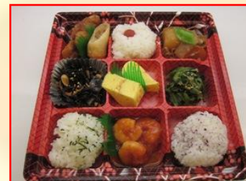
人気 たまて箱 (9彩) ¥680 (税込)