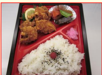
唐揚げ弁当 ¥580 (税込)