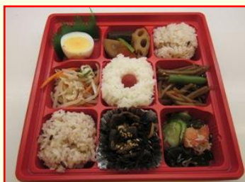
和風御膳 ¥680 (税込)