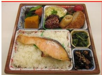
松花堂弁当 ¥680 (税込)