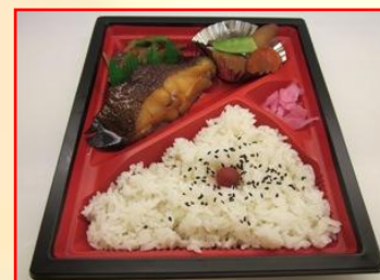
美味 カイの煮付け弁当 ¥680 (税込)