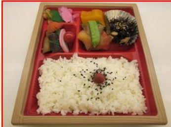
特製 和風弁当 ¥600 (税込)